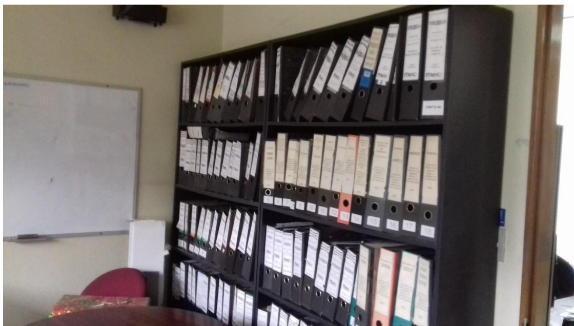
OFICINA DE LA DIRECTORA