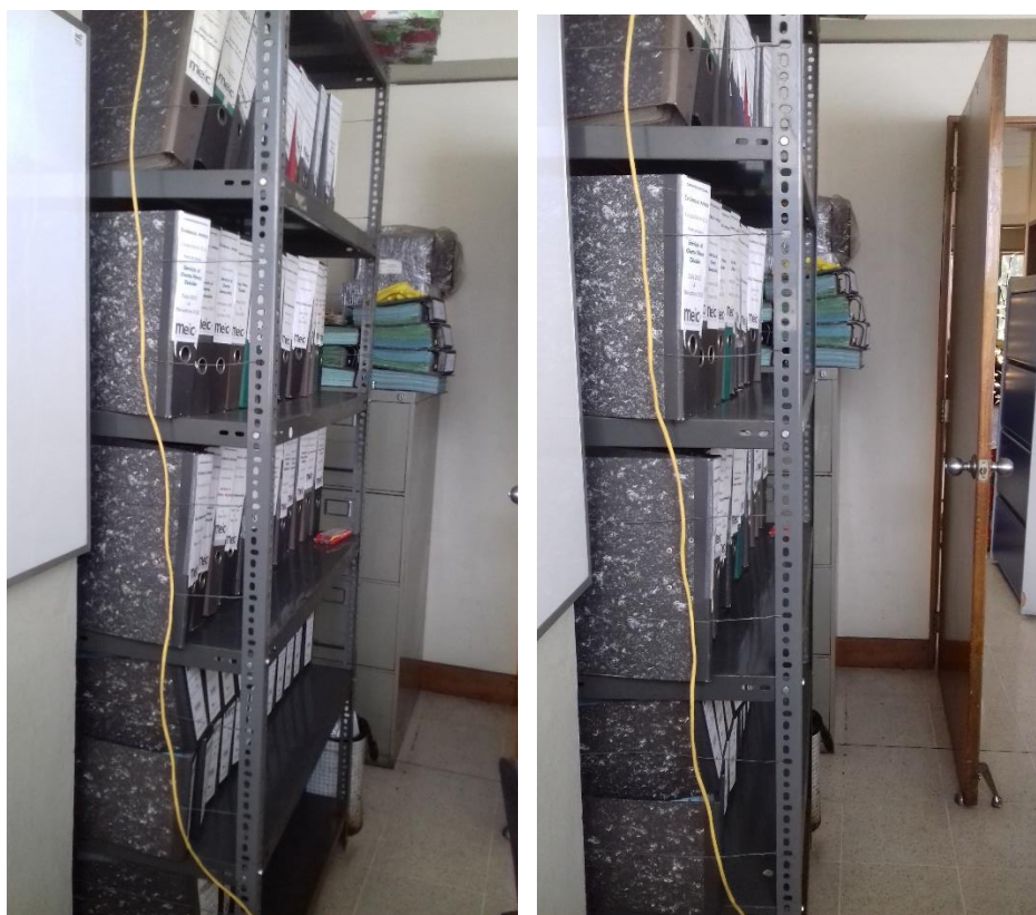
SALA DE REUNIONES