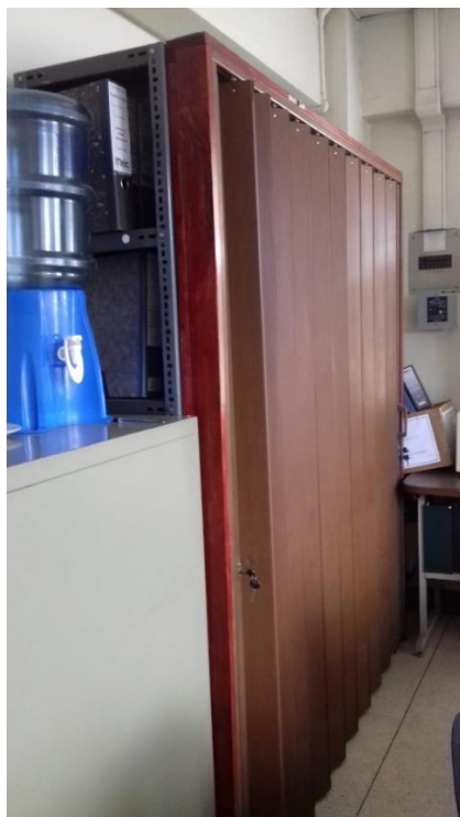
SALA DE REUNIONES