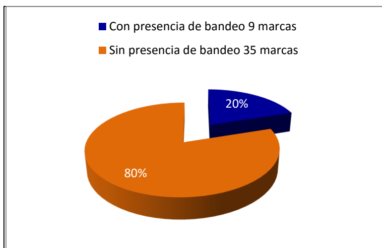
Gráfico N° 2 Porcentaje de marcas con práctica de bandeado en la comercialización de arroz