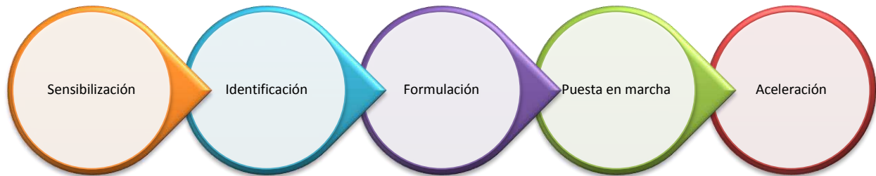
Figura 5. Cadena de Valor del Emprendimiento