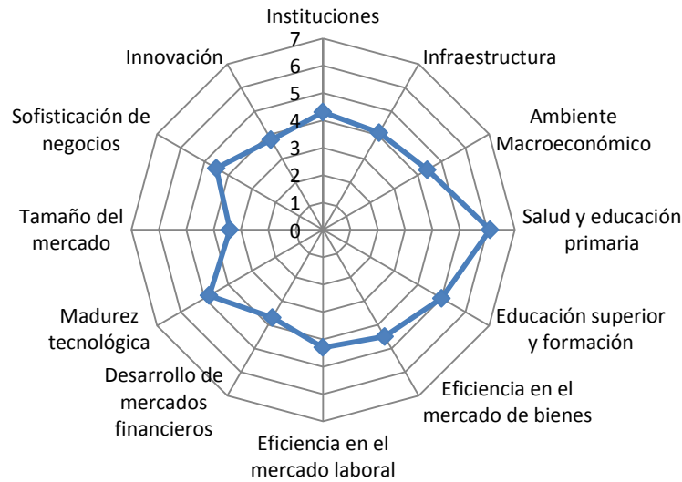
Figura 1. Costa Rica. GCI 2014-2015