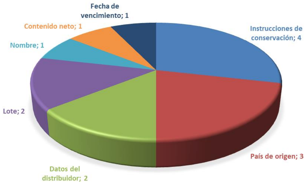
Gráfico N° 3. Cantidad de incumplimientos de etiquetado en los comercios por variable analizada de productos preempacados