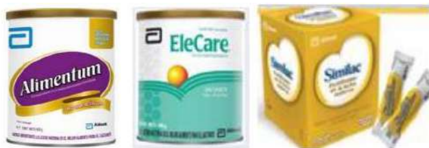
Marcas de fórmula infantil en polvo

Pro Consumidor en conjunto con DIGEMAPS, informa a los consumidores dominicanos que de acuerdo a la alerta emitida por la Food and Drugs Administration (FDA), la empresa Abbott, ha iniciado un retiro voluntario proactivo de algunas fórmulas infantiles en polvo, fabricadas en Sturgis, Michigan, EE.UU